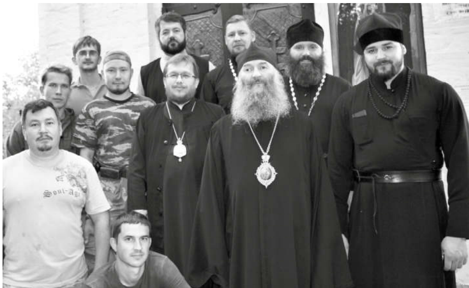
Археологи, епископ Паисий, архиепископ Йошкар-Олинский Иоанн, духовенство на месте проведения работ после нахождения захоронения

Археологам КОГАУК «Научно-производственный центр по охране культурного наследия Кировской области» было известно примерное местоположение погребения. Их задачей было обнаружение могилы преподобного Матфея и научная фиксация проводимых работ. И в конце недели на глубине 2,5 метра мощи преподобного были найдены. Хорошо сохранилось священническое облачение, нательный и параманный кресты, четки, монашеский пояс. Найденные вещи, расположение могилы и мощи, обретенные в костях, говорили о том, что найдено именно захоронение святого. Все присутствовавшие почувствовали тихую