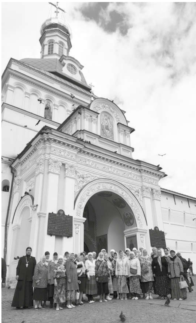
У стен святой обители

кой надежный и добрый, верный святой друг, с которым жить не страшно. Как бы ни было трудно, Божий Угодник не оставит в беде — мгновенно придет на помощь, если его с чистой душой и благими помыслами призовешь. Россия звала, мечтала о встрече с Чудотворцем. И мечта сбылась: по Божьему промыслу Святитель Николай нарушил свой уединенный в небольшом итальянском портовом городке покой и сам посетил нашу страну — Чудотворец же все может! Этим летом неиссякаемый