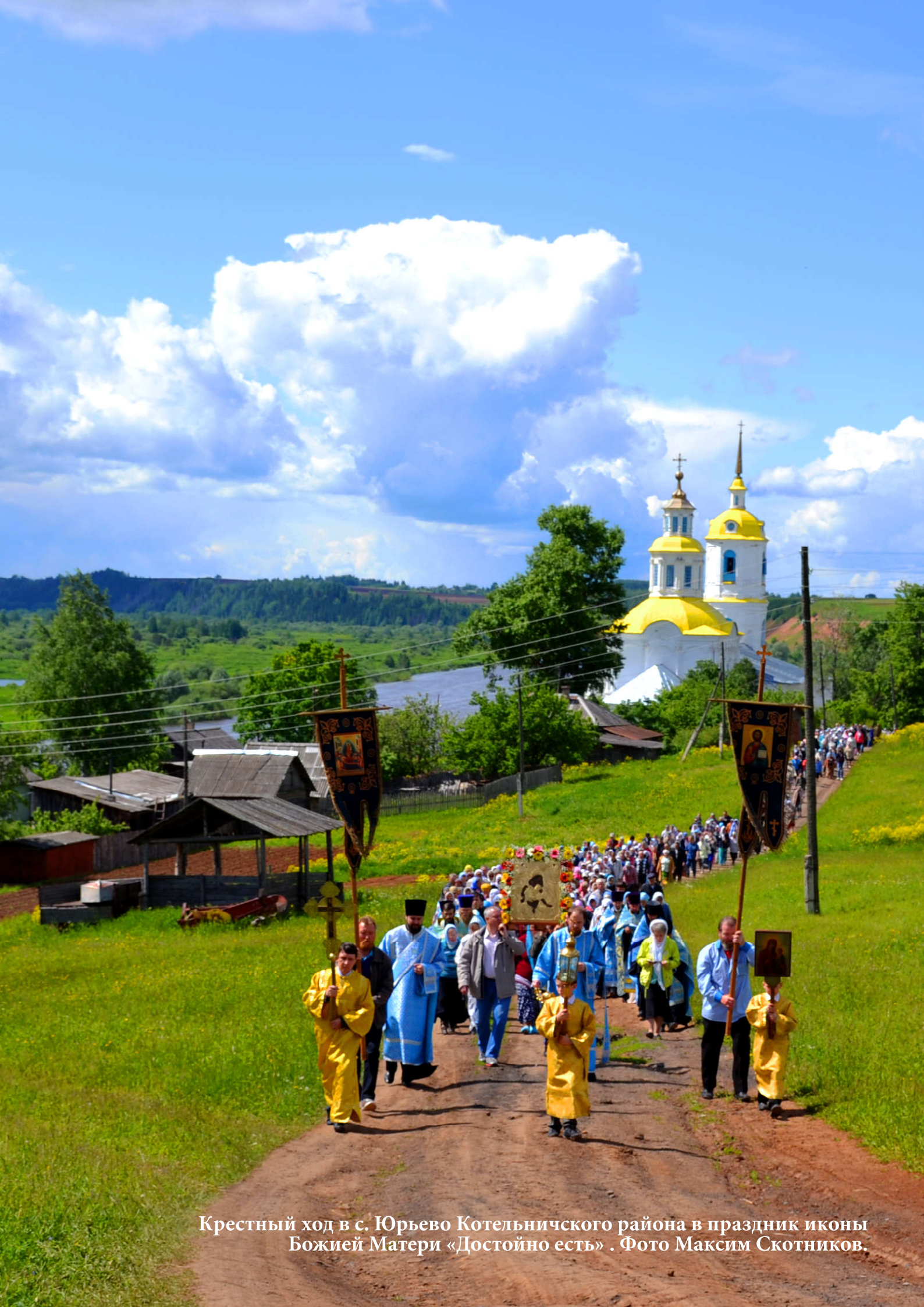
Крестный ход в с. Юрьево Котельничского района в праздник иконы Божией Матери «Достойно есть» .