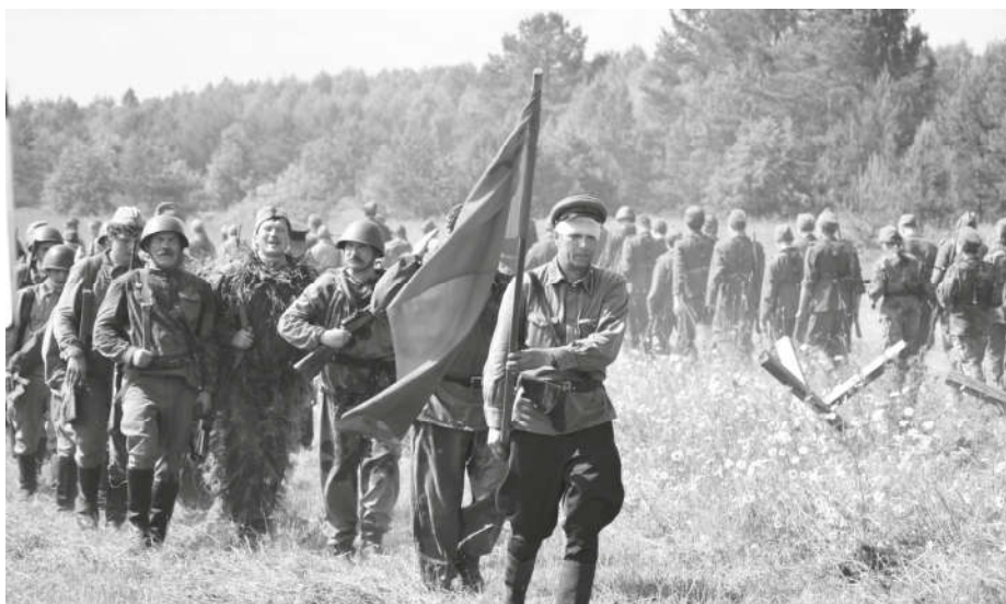
Участники реконструкции продемонстрировали бой Советской армии с солдатами вермахта, который проходил в 1942 г. в урочище Присморжье Новгородской области

15 июля на Свечинской земле состоялся VI межрегиональный молодежный фестиваль исторической реконструкции «Ратники святой Руси». Фестиваль организован приходом Никольского храма п. Свеча Яранской епархии, при поддержке администрации Свечинского района.