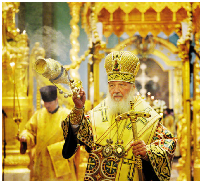
Святейший Патриарх Московский и всея Руси Кирилл.

Святитель Иоанн Златоуст учит нас, что мы, осознав свои недостатки, должны мало-помалу стремиться их исправить. Какие правильные слова! Не в мгновение ока, не наскоком, не посредством бурной и краткотечущей деятельности, а мало-помалу. Мы знаем, что в военной стратегии есть такое понятие, как направление главного удара. Нельзя наступать одновременно по всей линии фронта — никаких сил не хватит, и враг может, разгромив на одном участке наступающие войска, окружить их и победить. Вот так и в духовной борьбе: нельзя наступать широким фронтом, пытаться все в себе исправить, да еще за короткое время. Нужно научиться выбирать главную цель, а каждый из нас, наверное, знает, какая цель для него главная. Нужно напрягать свои силы, и молиться, и призывать Божию помощь, чтобы исправить тот самый главный свой недостаток, который более всего мешает духовной жизни.