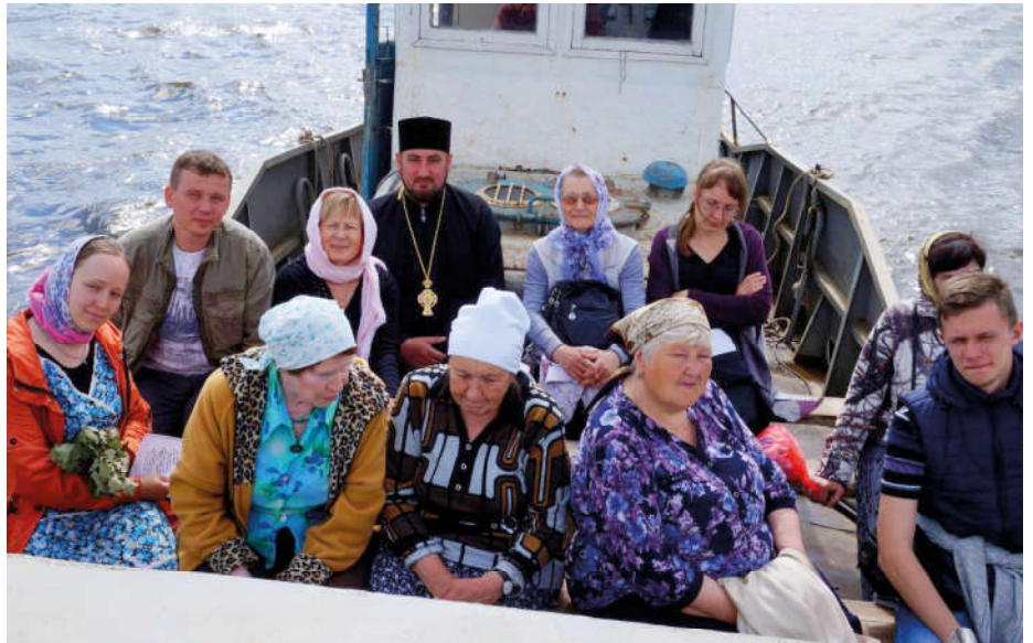
Путь на остров Залит.