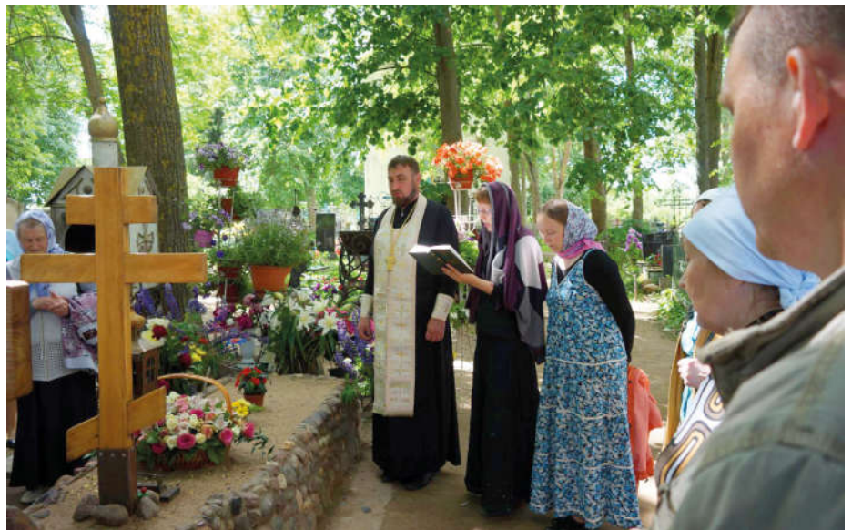
Умогилки отца Николая Гурьянова.

бывания в монастыре 5 июля. Подъём в 5 утра и до 10-45 личное время. Предстоит две экскурсии: первая по территории монастыря, а вторая в «Богом зданные пещеры» (в них покоится более 10 тыс. человек.). Сложно передать словами чувство благоговения на месте погребения великого старца Иоанна Крестьянкина. Прочувствовали всю скорбь, всю беззащитность людей перед вечностью, осознали волю Божию.